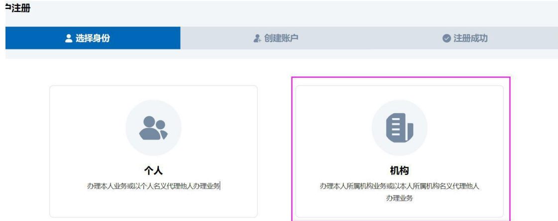
身份选择图（记得公司申请著作权要选择机构）